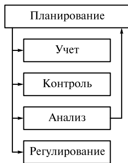
Рис. 1.5. Место экономического анализа в управлении

том взаимосвязей их элементов, научным обоснованием управленческих решений, выявлением факторов, влияющих на экономические системы и их элементы, раскрытием тенденций и пропорций хозяйственного развития, определением неиспользованных внутривозможных резервов.