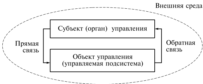
Рис. 1.1. Укрупненная структура системы управления

Деятельность организации сопровождается возникновением социально- и психолого-экономических отношений. Наряду с технико- и финансово-экономическими аспектами хозяйственная деятельность характеризуется отношениями между людьми в ходе производства, распределения, обмена и потребления продуктов труда, зависит от интересов и целей участников финансово-хозяйственного процесса, отношений между социальными группами. Это обуславливает необходимость комплексного изучения вопросов организации производства, экономики, финансов, социологии и психологии.