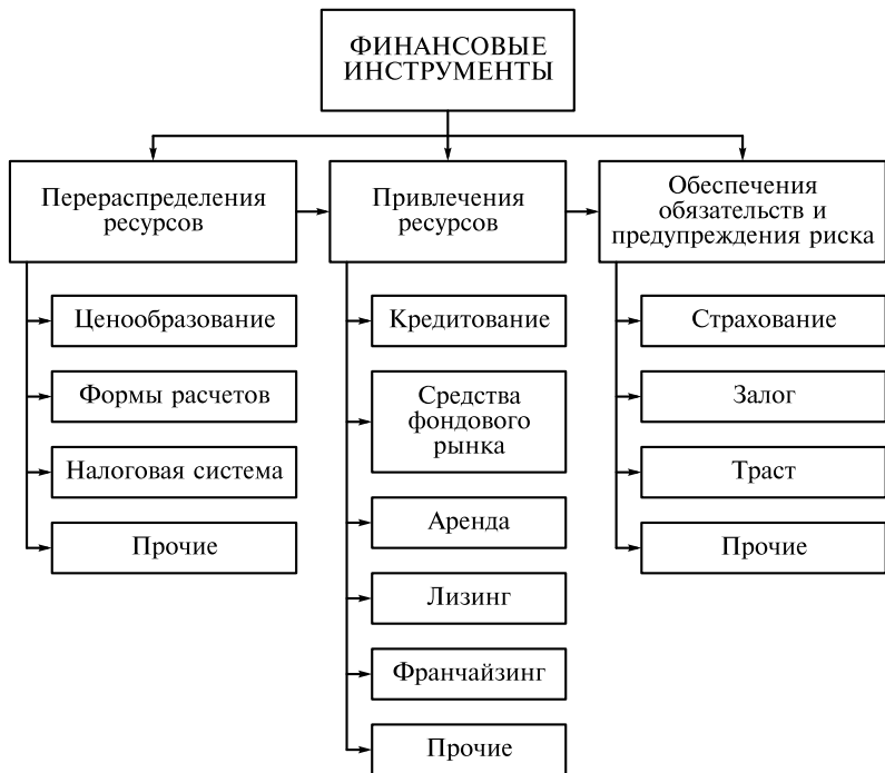
Рис. 1.4. Состав и взаимосвязи финансовых инструментов

пределение ресурсов относится к одному из способов их привлечения.